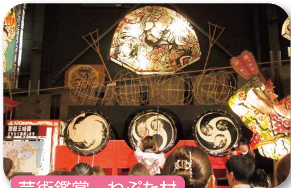
芸術鑑賞 ねぷた村