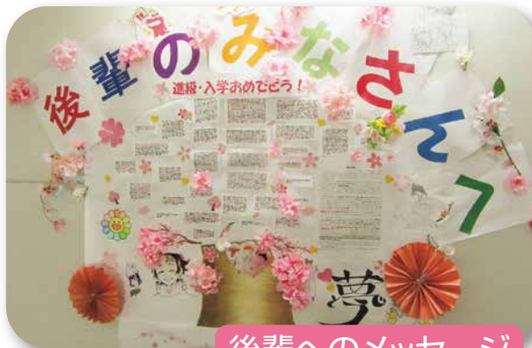
後輩へのメッセージ