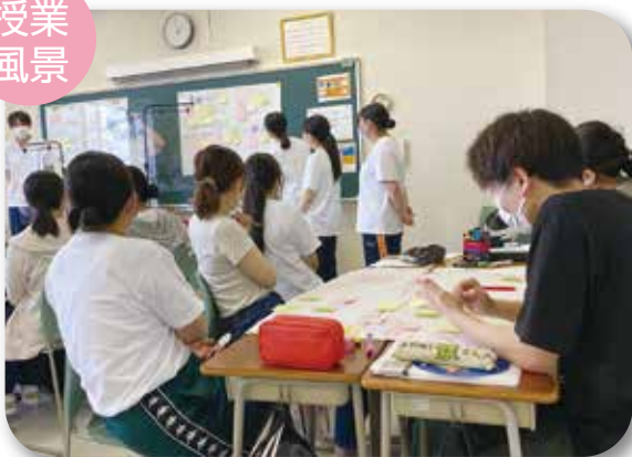
授 業 風 景