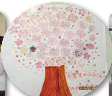
在校生からの メッセージ