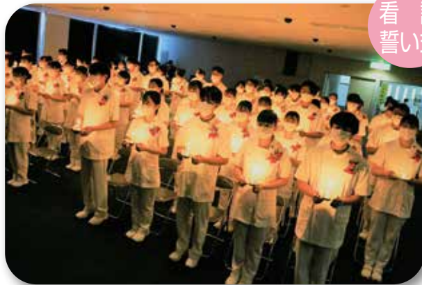
護 誓 式 看