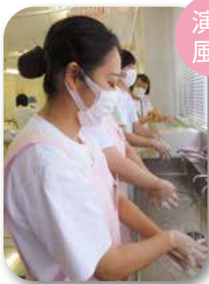
演 習 風 景